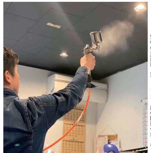
空中の浮遊菌を落とすから床の除菌作業を行う

「[lovertime]」の設置が可能になる。下の空間を有効活用でき、収納力アップに加え階下への騒音防止にも効果を発揮する。この床下空間を利用して床の高さを調整することで、