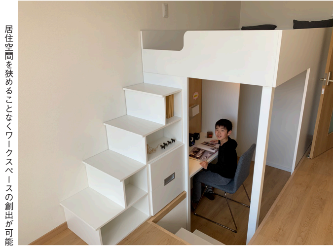
居住空間を狭めることなくワークスペースの創出が可能

垂直空間を有効活用し ワークスペースを確保 いまだ終息の兆しが見えない新型コロナウイルス。感染防止策を徹底しながら経済活動の継続が求められる「ウィズコロナ」体制の長期化が見込まれるなか、賃貸住宅のあり方も変化への柔軟性が必要になってくる。